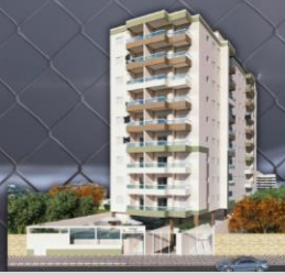
TABELA DE VENDAS